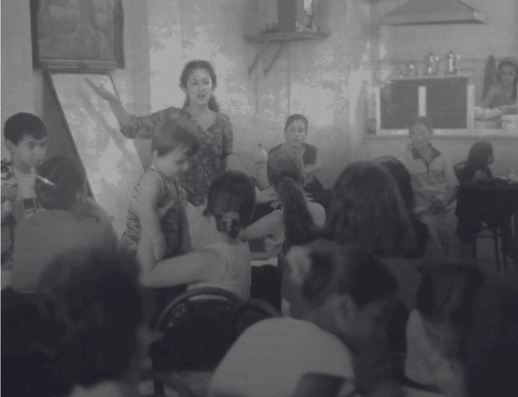
22 Haziran 2002, "Kadınlar, Erkeklerden ve Toplumdan Alacaklarını İstiyor" Kampanyası

Bu politika notunun amacı, yoksulluk nafakasının mevcut koşullarını, uygulamalarını ve sürekliliğiyle ilgili tartışmaları analiz etmek ve bu konuda olası politika değişikliklerini değerlendirmektir. Kapsamında, yoksulluk nafakasının uygulanması, cinsiyet ve süre faktörleri, süresiz nafaka eleştirileri, kadın örgütlerinin süresiz ibaresine karşı eleştirileri ve diğer ülkelerdeki nafaka prosedürleri ele alınmaktadır.